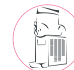
granitore di nuova generazione