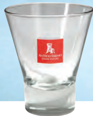
bicchiere di vetro 25 cl. • cod. 09984