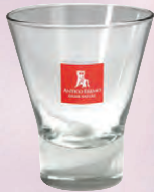
bicchiere di vetro 25 cl. • cod. 09984