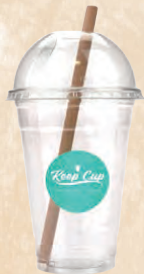
bicchiere da asporto 400 cc • cod. 099991