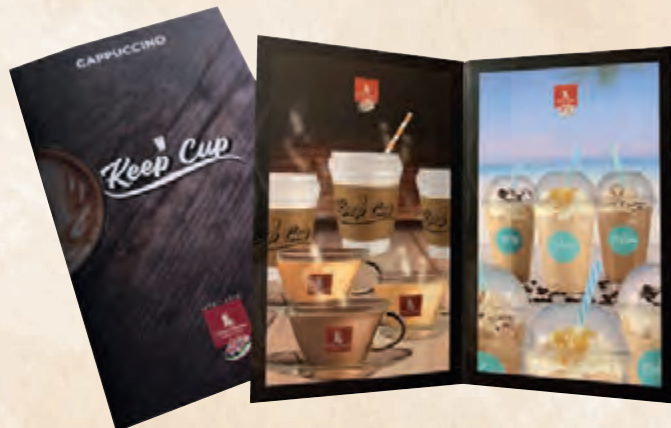
menu 10,5x30 • cod. 09990 ANT