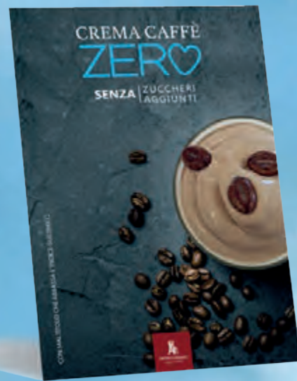
cartello da banco 21x30 cm • cod. 90192