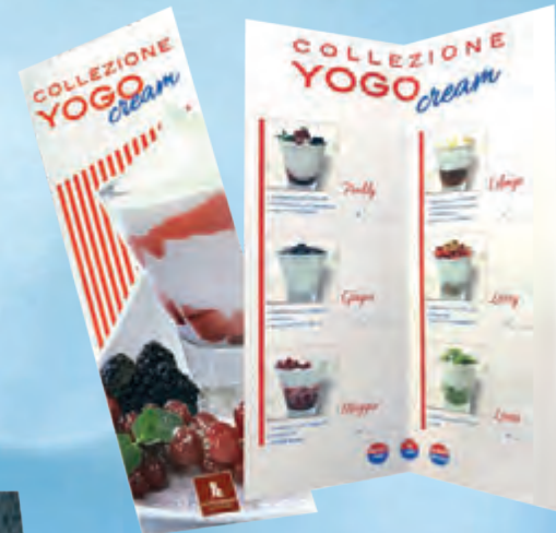
menu 10,5x30 cm • cod. 09975 ANT