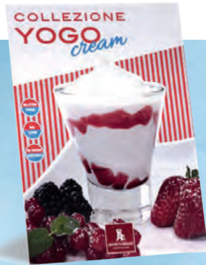
cartello da banco 21x30 cm • cod. 90081