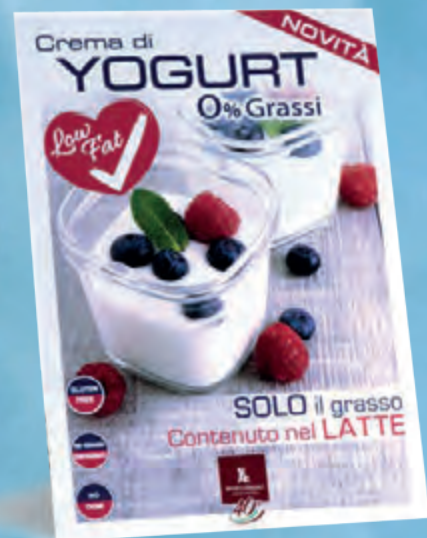
cartello da banco 21x30 cm • cod. 90166