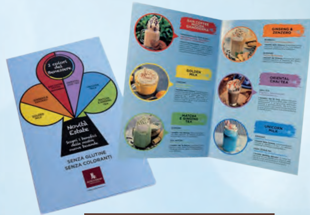
menu 10,5x30 • cod. 09972 ANT