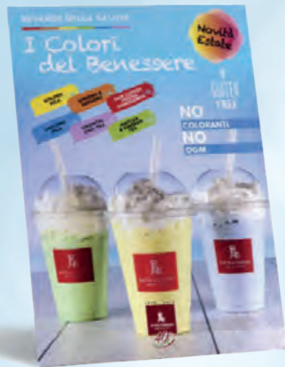
cartello da banco 21x30 cm - cod. 90172