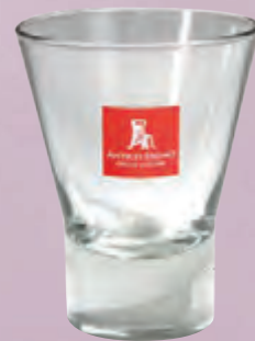
bicchiere di vetro 15 cl. • cod. 09984 ANT