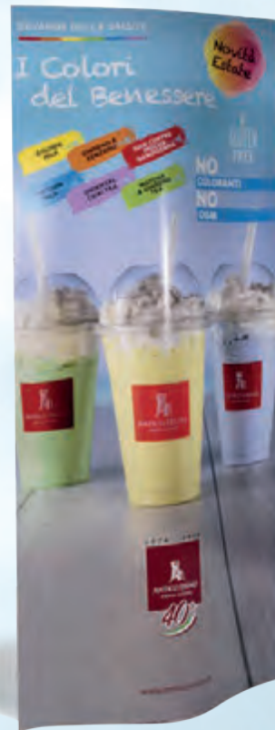
totem bifacciale 45x120 cm - cod. 90182