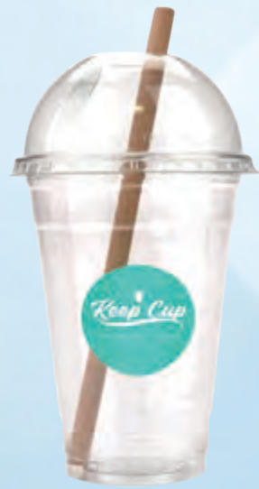
bicchiere da asporto 400 cc • cod. 099991