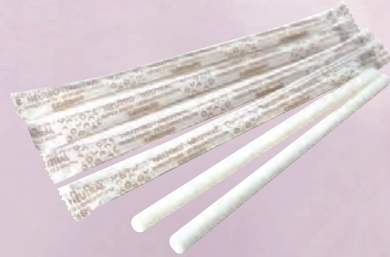
cannucce di zucchero cod. 90190