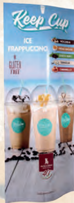
totem bifacciale 45x120 cm - cod. 90182