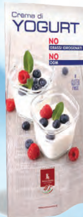
totem bifacciale 45x120 cm • cod. 90177