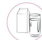
acqua o latte