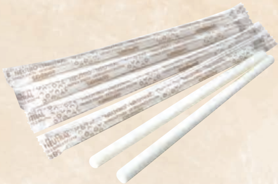
cannucce di zucchero cod. 90190