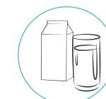
acqua o latte