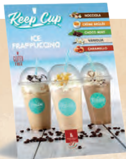
cartello da banco 21x30 cm - cod. 90172