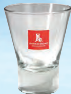
bicchiere di vetro 15 cl. • cod. 09984 ANT