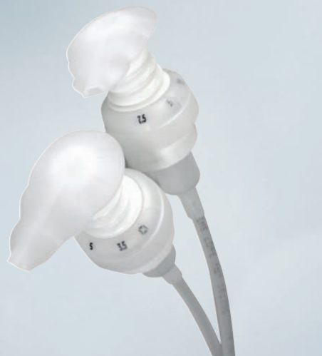
pompette dosatrice 3,5 - 5 - 7,5 ml. • cod. 06998ANT