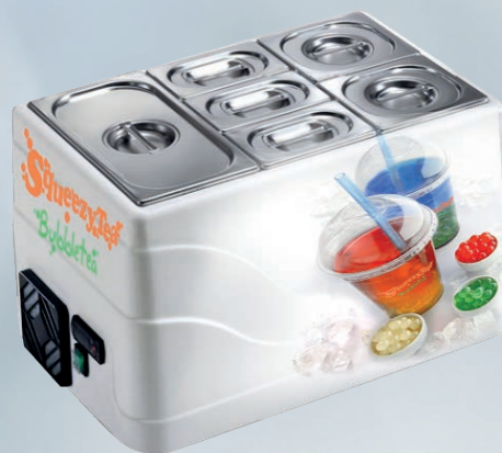
refrigeratore da banco 9 contenitori