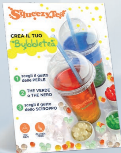
cartello da banco 20x30 cm