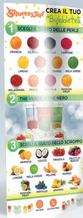
totem bifacciale 120x45 cm