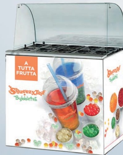
refrigeratore con cupolino in vetro