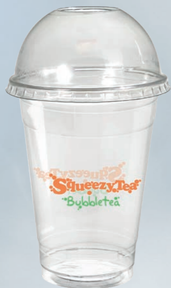
bicchiere da asporto 500 cc