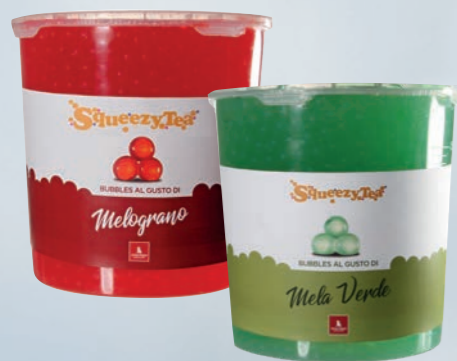
perle di frutta