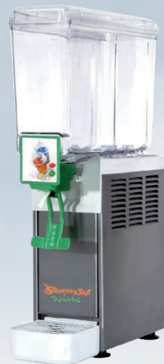
frigobibita 12 lt.