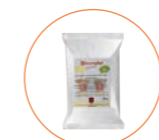
the verde o nero