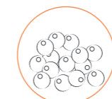
perle di frutta